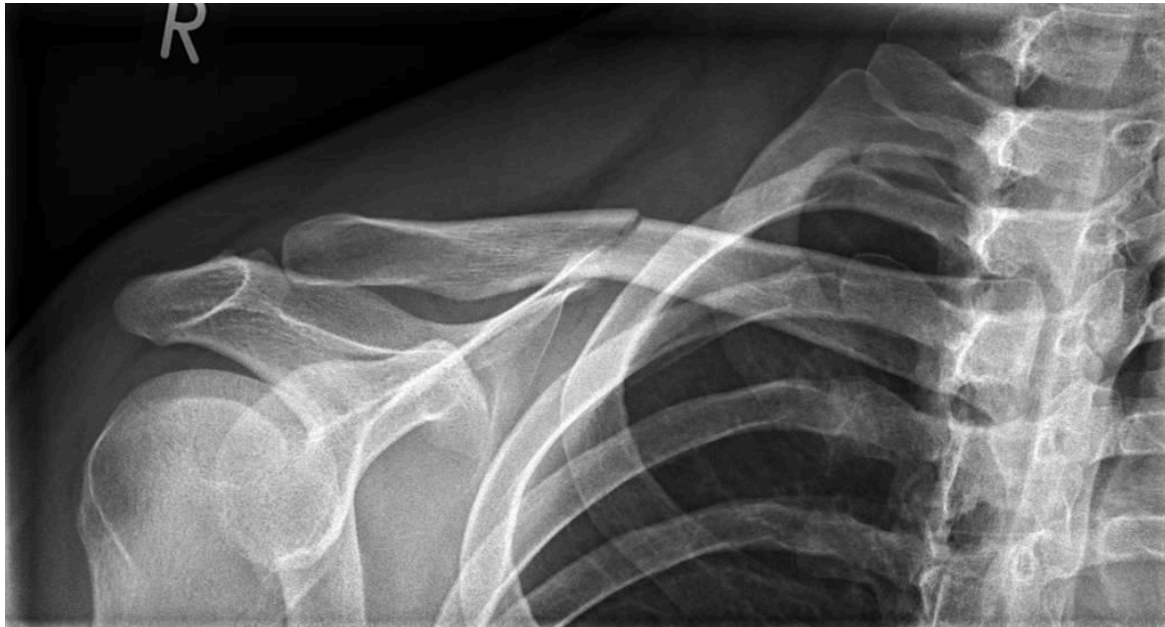
Unfall 20.05.2024 rechtes Schlüsselbein